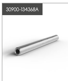
Rope Connector skarvhylsa