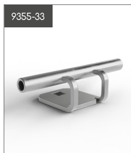
Rörfäste stolpe kort