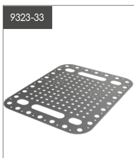
Bottenplatta Papp & Duk