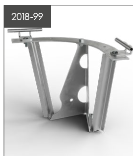
Komplett hörn släta tak