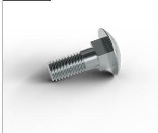
Vagnsbult MVBF 10x30 A4