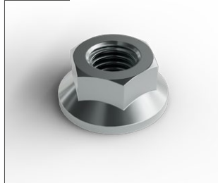
Fläsmutter M6MF M10 A4 Råfflad